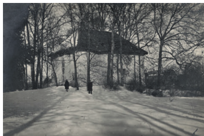
Kuusiku nn Munga ait enne Teist maailmasõda, vaade edelast Vigala jõe poolt

Viimane väide, nagu Kabala puhulgi, ongi tõenäolisem kui kabel. Varemete ümber on praegugi näha vallikraavi jäänuseid ja tõenäoliselt valvas seegi linnus veskikohta ja ülepääsu jõest nagu Kabala omagi. Ja võis samal ajal olla ka ait – miks mitte täpselt see, milleks teda on nimetatud: Padise kloostri kuulunud maavalduse keskus, kuhu toodi kokku mingi osa talupoegadelt kogutud viljast jms. Mis oleks järjekordne argument selle kasuks, et keskajal võis eksisteerida „Padise maantee“, mis viis Padiselt kloostri valdustesse Harjumaa lõunaotsas. „Munga aidast“ Paka mäe ja