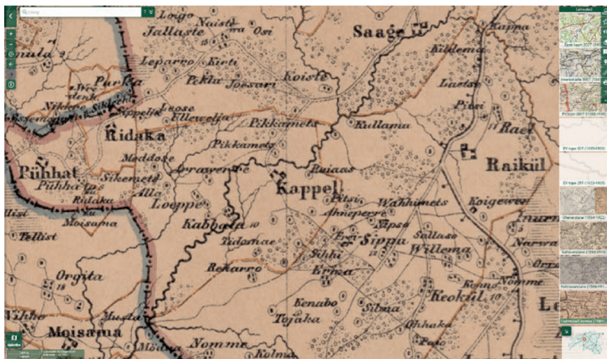
Kabala-Raikküla ümbrus tänapäevasel kaardil ja 19. sajandi algupoolel valminud C. G. Rückeri maakaardil

Ent siin tasub põnevate hüpoteesidega ilmselt hoogu pidada. Isegi kui oleks võimalik tõestada, et de Thoysi teenistuskohal oli tõesti Otepää Kabala lähedal, mitte Lõuna-Eestis, ei annaks see meile muud kui oletuse, et kabel, millest jutustab rahvapärinus ja millest Kabala mõis usutavasti oma nime on saanud (sks Kappel ), ei asunud mitte mõisasüdamel, hilisema mõisahoonel kohal, vaid mõni kilomeeter põhja pool künkal. Mõis aga – esialgu arvatavasti väike linnus – rajati Vigala jõe äärde, kus asus või kuhu rajati veski või veskid ja sillakoht. Muidugi oleks seegi huvitav teadmine.